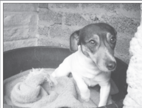
A lovely Jack Russell x female, two years old is one of the residents at the SPCA who are up for adoption.

Onthou asseblief dat raaisels/inskrywings waarvan die uitgawedatum ontbreek, ongelukkig nie vir die prysgeld in aanmerking sal kom nie.